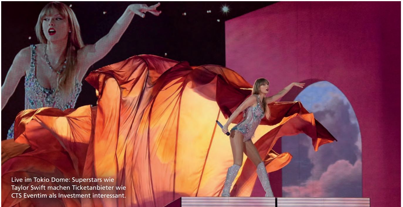
Live im Tokio Dome: Superstars wie Taylor Swift machen Ticketanbieter wie CTS Eventim als Investment interessant.