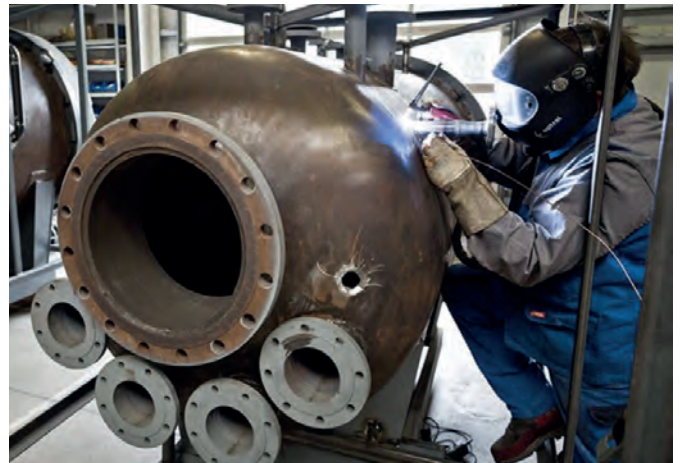
Dampfautoklaven von MK Technology: Sie sind für den Einsatz von Hochdruck- und Hochtemperaturdampf zur Abtötung von Mikroorganismen ausgelegt.

Hinzu kommen an vielen Orten des Landes Partnerschaften und Technologietransfers zwischen Hochschulen und Unternehmen. Dass allein in der niedersächsischen Stadt Göttingen 39 Messtechnik-Unternehmen ihren Sitz haben, hat viel damit zu tun, dass die mathematische Fakultät der dortigen Universität lange Zeit als weltweit führend galt: Auch wenn ihr Ruf in jüngster Zeit etwas gelitten hat, rangierte die Universität Göttingen im jährli-